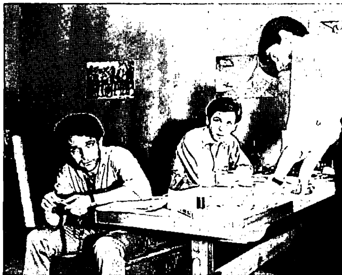
« Kierion », de Demosthène Theos

d'un sou », œuvres originales et sincères — qui ne tardèrent pas à secouer une production nationale enfoncée dans la médiocrité : point de départ décisif, non seulement pour d'autres jeunes qui se